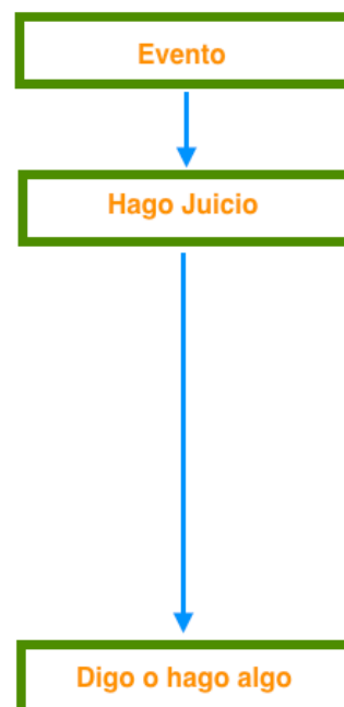
Diagrama 1 de 3

En la cultura que vivimos es habitual el que después de hacer un juicio sobre el evento que vemos o escuchamos, expresemos o hacemos algo en consecuencia al inevitable juicio que hicimos. Los Juicios los hacemos conforme a nuestra Circunstancia existencial en la que nos encontremos. Me refiero como Circunstancia existencial de la persona a todo lo que le ha pasado en su historia, lo que está viviendo en el presente y lo que espera de su futuro. Esto, en todos los ámbitos de su vida: el familiar, el social, el de su salud y otros, todos ellos con sus influencias culturales.