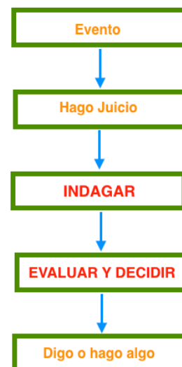
Diagrama 3 de 3

Además de indagar o corroborar qué tan cierto o falso es el juicio que estamos haciendo sobre algún evento que vimos o escuchamos, es beneficioso evaluar conforme a nuestra Circunstancia existencial la mejor respuesta que podamos hacer y con todo ello, tomar la decisión de lo que voy a expresar o hacer conforme al grado de Congruencia que queramos y que podamos tener en ese momento. Pienso puede clarificar esta decisión, los 7 elementos que manejo en la Congruencia en